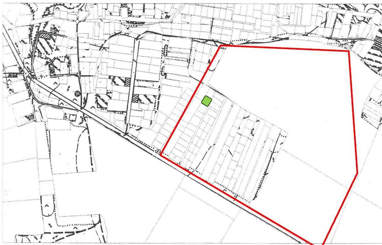
Схема расположения участка проведения археологических работ