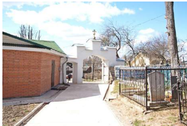
Входные ворота с оградой.