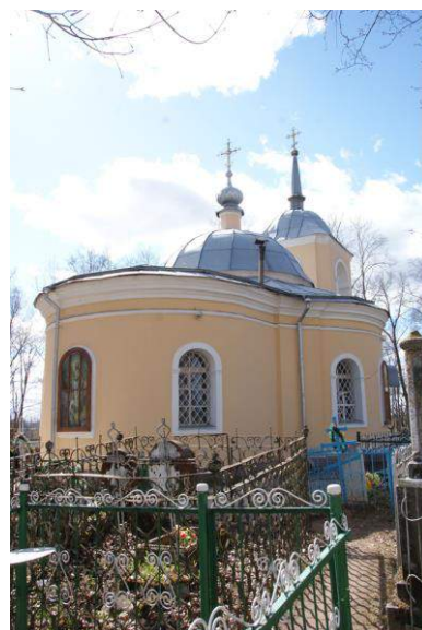
Вид с северо-востока.