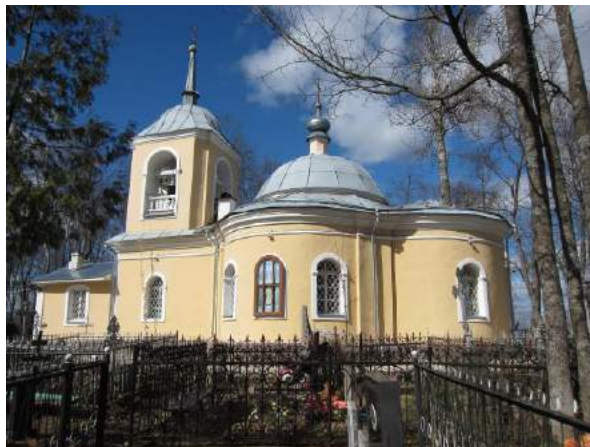
Южный фасад здания